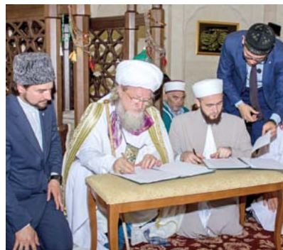
Подписание «Акта передачи...»