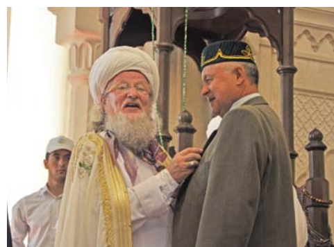
Награждение медалями ЦДУМ России