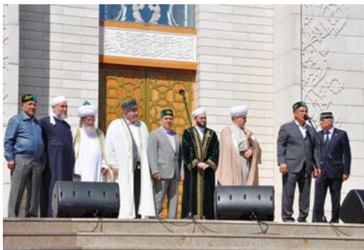
Передача Священной реликвии - волоса Пророка Мухаммада (с.г.в.) на хранение в Древнем Булгаре