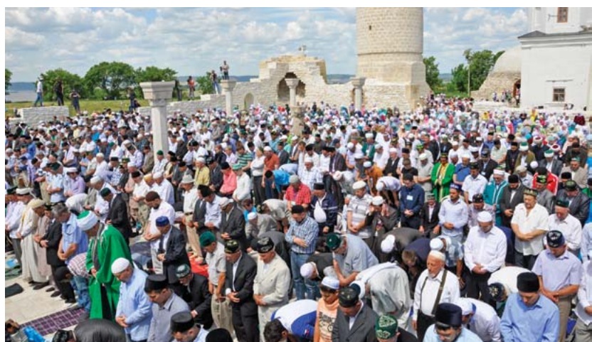
Масжид-Джамиг. Полуденный намаз