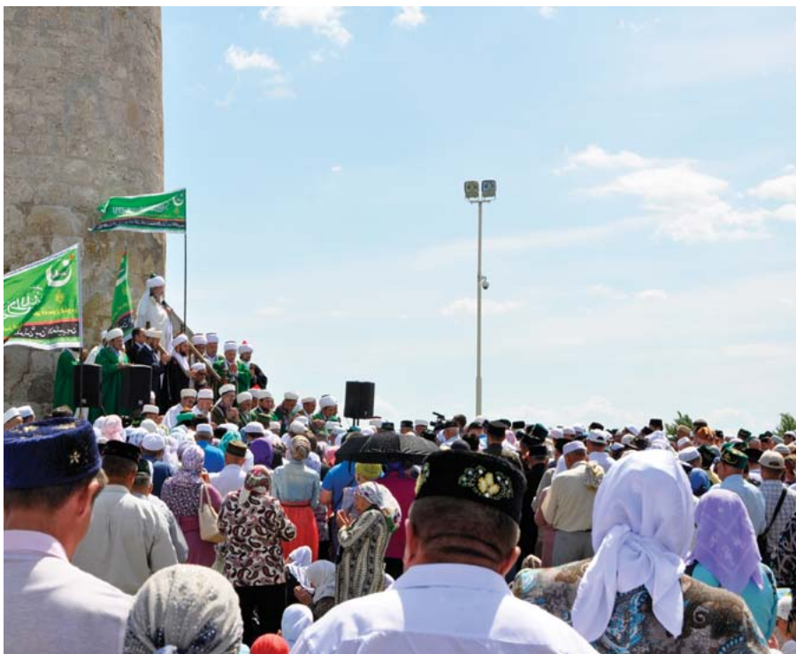
Тауба - молитва покаяния